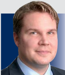
- Dr. Marco Rogert Rechtsanwalt/Wirtschaftsjurist Dr. Rogert · Ulbrich & Partner